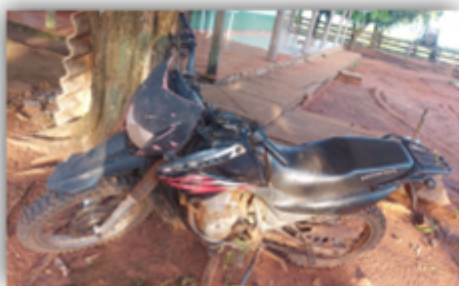
Motocicleta Honda XR 200R