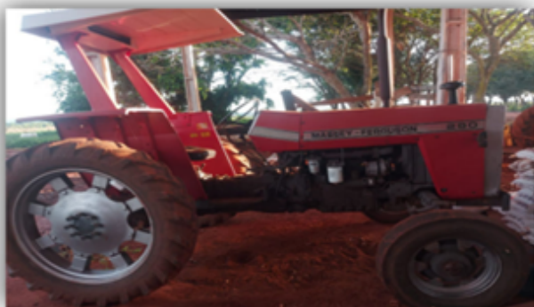
Trator Massey Ferguson 290