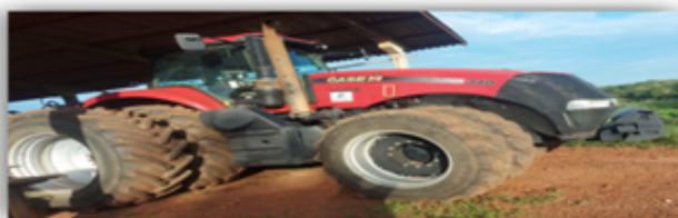
Trator Case Magnum 340