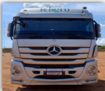
Mercedes Benz ACTROS 2651S 6X4