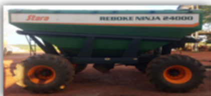
Reboke Ninja 24000