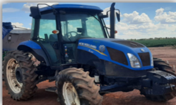
Trator New Holland TL95E

A essencialidade dos tratores em questão resta demonstrada, por estarem diretamente relacionados às atividades dos devedores nas operações agrícolas desempenhadas pelo Grupo.