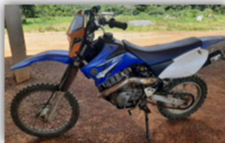
Motocicleta Yamaha TTR