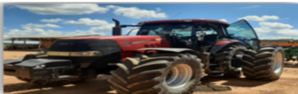
Trator Case Puma 230