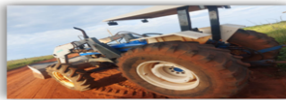
Trator New Holland 8030