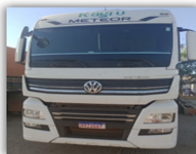
Volkswagen 29.530 MTM 6X4

O barracão constante da pág. 47 do Id. 137190316 é utilizado para armazenar, de forma segura, os insumos e maquinários.