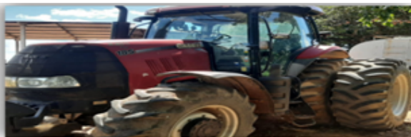
Trator Case Puma 185 sps