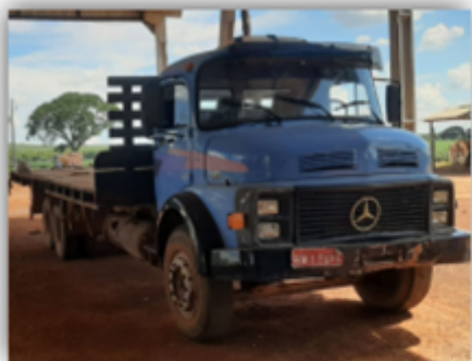
Caminhão Mercedes Benz LA1113