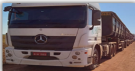
Mercedes Benz ACTROS 2651S 6X4